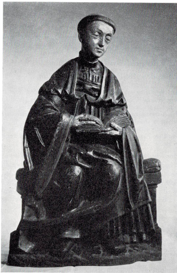
Vir dei Benedictus

Spätgotische Statue süddeutscher Herkunft im Kollegium Sarnen